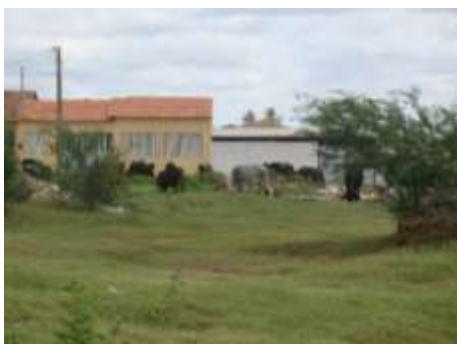
Figura 3 – Pecuária extensiva e construção civil nas margens do riacho.