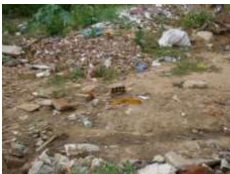
Figura 5 – Resíduos sólidos.