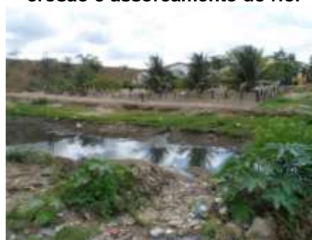
Figura 4 – Ausência de mata ciliar, construção civil, lançamento de esgoto, erosão e assoreamento do rio.